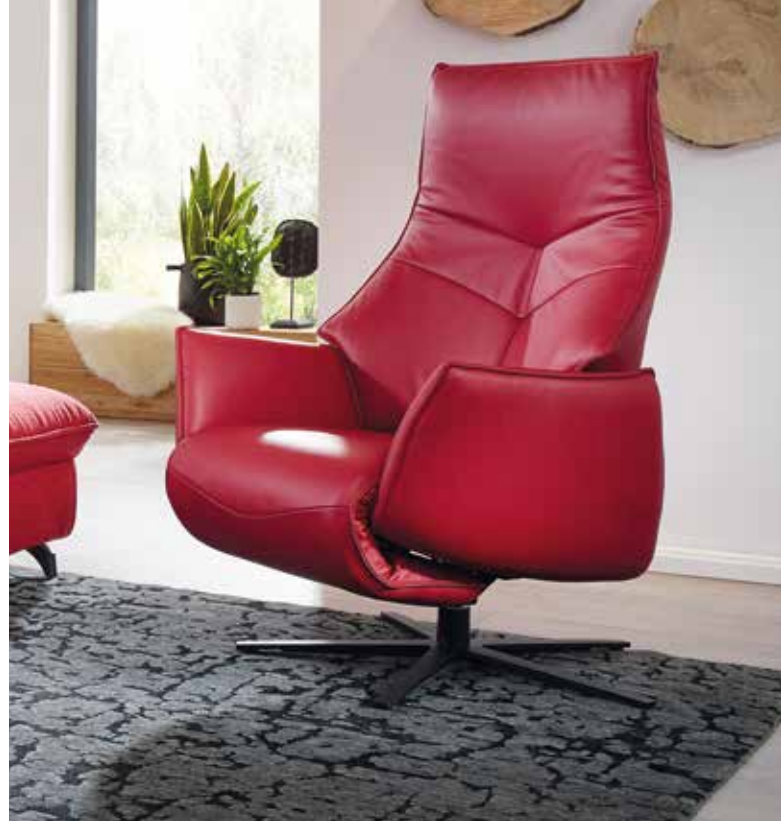
Funktionsessel , in strapazierfähigem Leder, motorisch mit Aufstehhilfe, BHT ca. 73 x 114 x 83 cm.