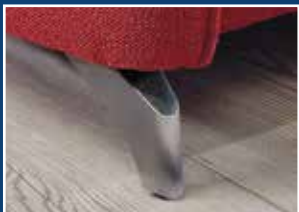
Edelstahl optik gebürstet.