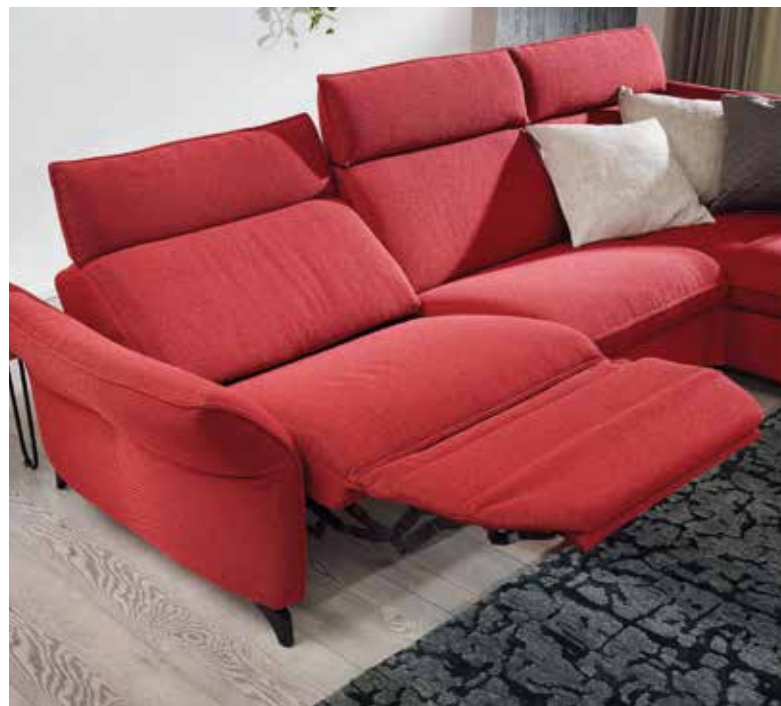
Wall-Free Funktion , manuell oder elektrisch.